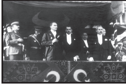
Türkiye Cumhuriyeti'nin 10. Yıldönümü Kutlamaları (29 Ekim 1933)