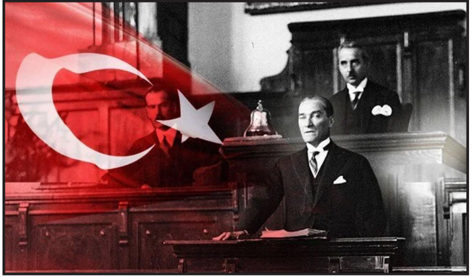
Mustafa Kemal Paşa, TBMM'de Konuşma Yaparken

Tarih: 28 Ekim 1923... Türkiye Devleti, bir hükümet kriziyle karşı karşıyaydı. 28 Ekim akşamı Çankaya Köşkü'nde yapılan bir toplantıda Mustafa Kemal Paşa "Efendiler, yarın cumhuriyeti ilan edeceğiz." dedi ve İsmet Paşa ile birlikte anayasada yapılacak değişikliklerle ilgili önerge hazırladı. Hazırlanan yasa teklifi 29 Ekim 1923'te TBMM'de oy birliği ile kabul edildi. Böylece cumhuriyetin ilanı gerçekleşmiş oldu.