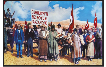
Cumhuriyet Bayramı Kutlamaları, Uşak (1933)